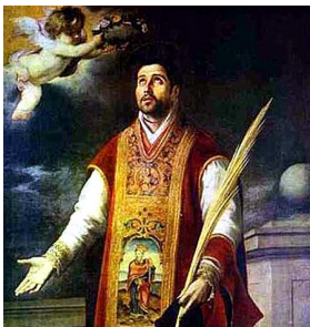
Barlomeu E. Murillo (+1682), S. Eulogio

El siglo IX sitúa a Eulogio en la historia porfiando de continuo con el Islam. Nace el santo hacia el año 800 en una familia cordobesa. Se educa entre el clero de la iglesia de san Zoilo. Su vida es una permanente e inquebrantable adhesión a la fe y a las tradiciones patrias. Quizás por eso se pensó en él como sucesor de Wistremiro, arzobispo de Toledo. Entra en el estamento clerical acompañado de un terrible sentimiento de indignidad. A su vuelta se